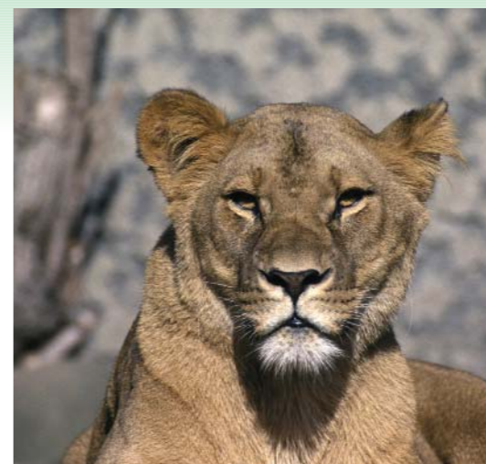
RUIMTE VOOR DIEREN De zebra in Artis heeft nu al meer ruimte. Voor onder andere de gorilla, de leeuw en de Afrikaanse wilde hond zal dat straks ook gelden.

En aan het Kennisplein kun je van een tongzoen zo