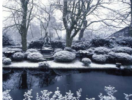
Japanse Tuin, met 'boedha'. Artis is ook een verzameling van cultuurtuinen met kunstobjecten.

Een belangrijke functie van het Kennisplein is dat van educatief centrum. Dit educatief centrum is bedoeld om schoolklassen te ontvangen (en door te geleiden naar de tuin) en om individuele leerlingen of andere geïnteresseerden verder te helpen. In dit educatief centrum is een aantal leslokalen ondergebracht, evenals een bibliotheek, annex mediatheek, annex studieruimte. De publieksafdelingen van Artis zullen in de directe nabijheid van het educatief centrum worden gevestigd.