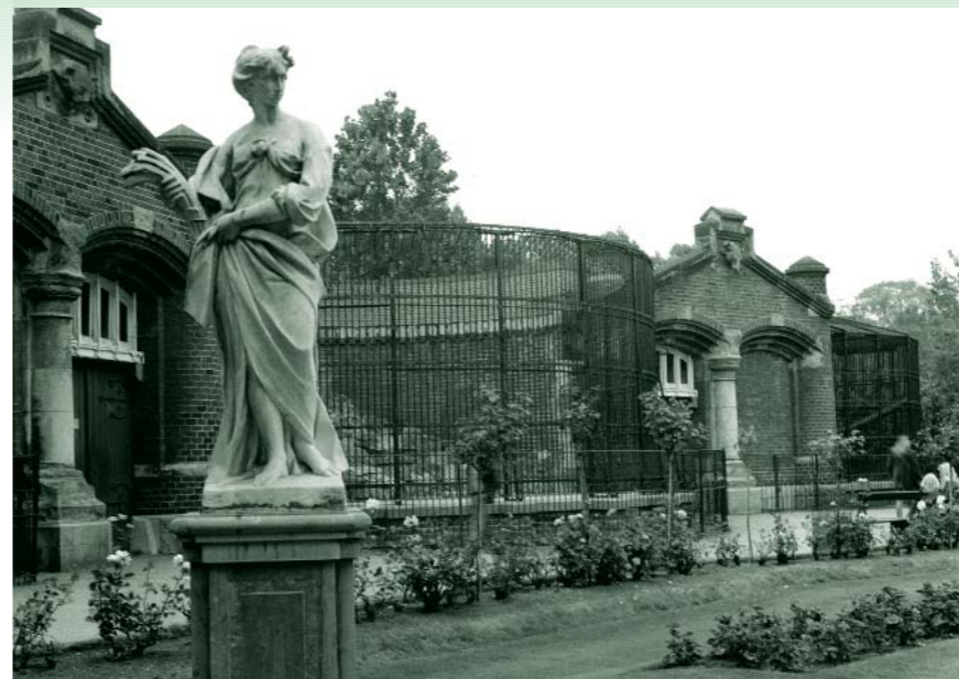
Naast de Hollandse Tuin bevond zich ooit het monumentale Berenpaleis, hier ca. 1970. (Tegenwoordig staat daar het Kleine-Zoogdierenhuis).