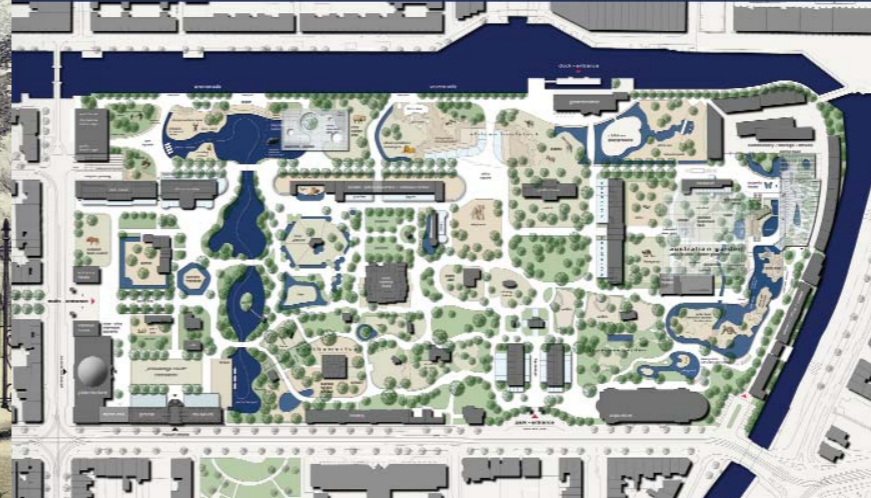
Een schets van het totale Masterplan dat een periode tot 2015 bestrijkt.

gebaseerd is op de oude Latijnse naam van het genootschap: Natura Artis Magistra (de natuur is de leermeesteres van de kunsten en wetenschappen):